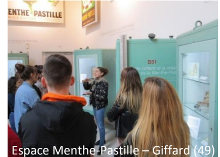
Espace Menthe-Pastille – Giffard (49)