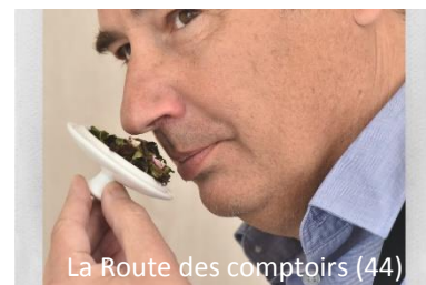
La Route des comptoirs (44)