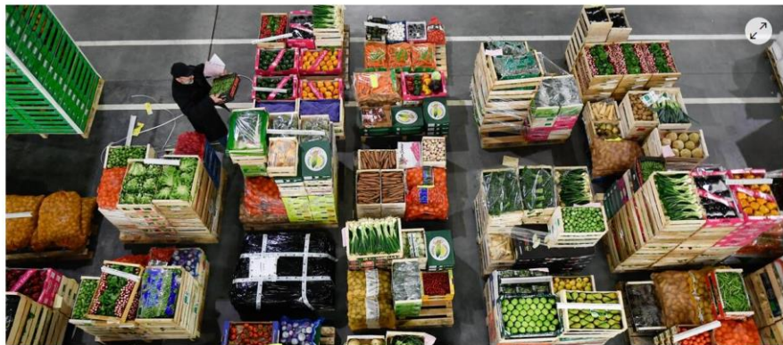
Le public pourra découvrir le Min ( Marché d'intérêt national ) de Nantes, deuxième en France après Rungis.

Le réseau Visitez nos entreprises en Pays de la Loire accueille de nouveaux membres en 2020. Des entreprises qui valorisent leurs savoir-faire. En 2019, 490 000 visiteurs sont ainsi partis à la découverte des activités économiques du territoire.