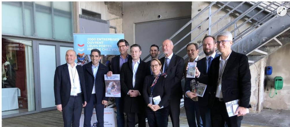
De nombreux partenaires nationaux ont répondu à l'invitation pour ces Rencontres nationales de la visite d'entreprise.

Les villes de Saint-Nazaire et Guérande accueillent la quatrième édition des Rencontres nationales de la visite d'entreprise. Un événement clé du tourisme industriel.