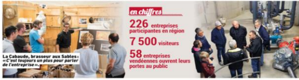
La Cabaudin, brasserie aux Sables : « C'est toujours un plus pour parler de l'entreprise »

en chiffres 226 entreprises participantes en région 7 500 visiteurs 58 entreprises vendéennes ouvrent leurs portes au public