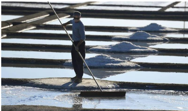
Une visite à la coopérative Terre de sel est prévue le 7 février 2020.

Organisée par Entreprise et découverte, la 4e Rencontre nationale sur les visites d'entreprise se déroulera les 6 et 7 février prochains à Saint-Nazaire et Guérande. Tables rondes, échanges et visites sont au rendez-vous.