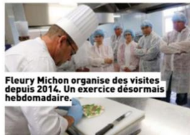
Fleury Michon organise des visites depuis 2014. Un exercice désormais hebdomadaire.