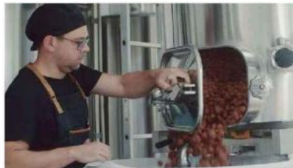
L'étape de la macération.