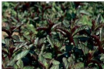
Champ de menthe de variété Mitcham à Chemillé-en-Anjou.