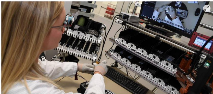
Thales est récompensé pour son volet technologique mais aussi management.

Thales labellisé « Vitrine Industrie du futur », Brioche Pasquier qui ouvre ses portes aux visiteurs, les nouveautés des Vergers de la Blotière... Voici les dernières informations économiques du Choletais et des Mauges.