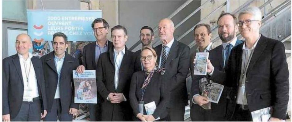
De nombreux partenaires nationaux ont répondu à l'invitation pour ces Rencontres nationales de la visite d'entreprise.