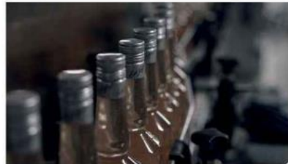
La mise en bouteilles.