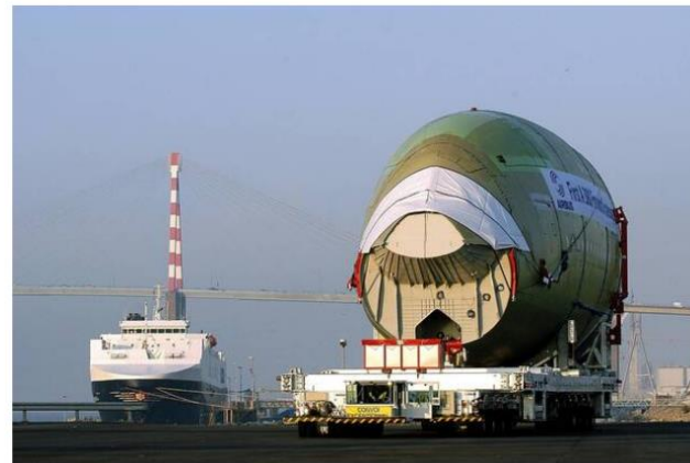
Les Chantiers de l'Atlantique et Airbus accueillent des touristes pour des visites de leurs sites industriels.

La place de ce tourisme dans le territoire sera aussi abordée : à quoi sert la visite d'entreprise pour le territoire ? Les participants seront invités à découvrir les savoir-faire de la région, avec des visites emblématiques : à Saint-Nazaire, territoire historiquement industriel, les participants pourront visiter les Chantiers de l'Atlantique, Airbus ou le port de Saint-Nazaire, le premier de la façade atlantique ; à Guérande, visite possible de Terre de Sel, filiale de la coopérative « Les Salines de Guérande ».