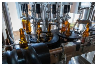
Brasserie de la Divatte (44)