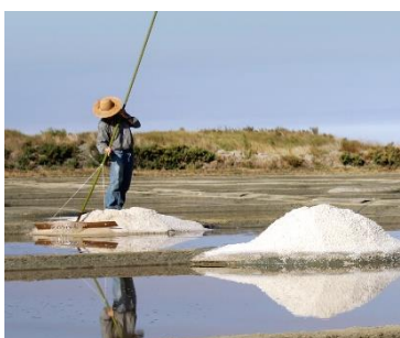
Terre de Sel (44)

Une parenthèse gourmande s'offre aux visiteurs qui iront à la découverte des savoir-faire régionaux cet été, à celles et ceux qui pousseront les portes des chocolateries, biscuiteries, fromageries, ruches, fumoirs (...), qui pénétreront dans les caves de tuffeau, parcourront les vignobles du val de Loire, les champs de safran ou les marais salants (...) ligériens.