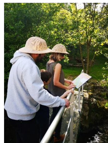
La Ruche de Mary (49)

En 2020, le réseau Visitez Nos Entreprises en Pays de la Loire , dont la mission première est d'accompagner les entreprises régionales qui font le choix d'organiser des visites tout en respectant une charte de qualité commune, rassemble 61 entreprises, réparties sur tout le territoire ligérien , 23 en Loire Atlantique, 25 dans le Maine et Loire, 3 en