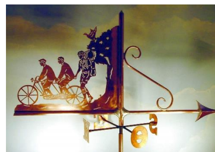
Atelier de la Girouetterie (49)

Au cœur de la Petite Cité de Caractère du Coudray-Macouard, à l'Atelier de la Girouetterie (49), le girouettier crée, restaure et reproduit des girouettes et enseignes en cuivre, en zinc et en laiton. A Tiercé, dans la petite entreprise artisanale et familiale Fer & Lignes (49), on découvre en direct le métier de la forge, du croquis au façonnage de l'ouvrage. Deux visites à faire ou refaire absolument cet été !