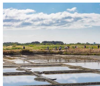
Terre de Sel (44)

Avec 15 millions de visiteurs en France chaque année, les visites d'entreprises remportent un succès croissant . Le tourisme de découverte des savoir-faire vient, en effet, compléter les offres touristiques traditionnelles et s'adresse à tous les publics . Une tendance récente qui répond aux aspirations tant des habitants que des touristes qui cherchent à donner du sens à leurs vacances, à vivre des expériences différentes pendant leur temps libre. Dans la région Pays de la Loire, plus de soixante petites, moyennes et grandes entreprises, de tous secteurs d'activités , membres de l'association Visitez Nos Entreprises en Pays de la Loire (VNE) s'ouvrent au public. En 2019, elles ont accueilli près de 500 000 visiteurs .