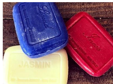
Savonnerie Gonnord (49)