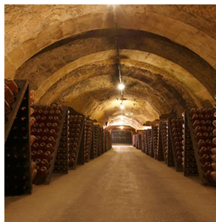
Cave Veuve Amiot (49)

Dans le Maine et Loire, à Saumur , la visite des maisons de vins (49) s'impose pour découvrir la subtilité des méthodes d'élaboration des fines bulles : Ackerman, Bouvet Ladubay, Cave Veuve Amiot, Gratien et Meyer, Langlois-Château, Louis de Grenelle proposent des parcours de découvertes, toutes différentes et originales, dans leurs caves.