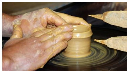
La Vieille Poterie de Nesmy (85)

Dans le petit hameau vendéen de Nesmy, la famille Charpentreau perpétue depuis 4 générations la tradition de la faïence ournée et garnie à la main , agrémentée d'un décor simple exécuté au pinceau : la visite de la Vieille Poterie de Nesmy (85) raconte l'histoire de l'atelier, montre la fabrication des poteries depuis le tas d'argile jusqu'à la décoration des objets.