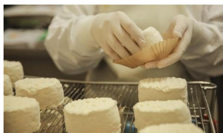
Fromagerie Beillevaire (44)

C'est en Loire Atlantique ou en Mayenne , que les amateurs de fromages et produits laitiers trouveront leur bonheur. A Pornic, la visite de la Fromagerie Le Curé Nantais (44) accueille le matin les visiteurs qui suivent toutes les étapes de la transformation du lait en fromage. A Machecoul, la Fromagerie Beillevaire (44) propose au choix des visites libres, guidées et gourmandes suivies d'un repas tout fromages. A Laval, c'est au musée de l'entreprise du groupe Lactalis que les visiteurs pourront découvrir la fabuleuse aventure de la production laitière, de l'activité artisanale à l'industrie de pointe, en faisant la visite incontournable de La Cité du Lait – Lactopôle® (53).