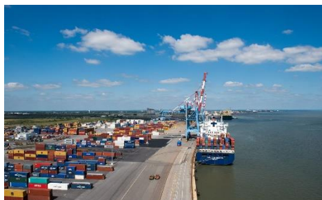
Nantes Saint-Nazaire Port (44)

Cet été, les fleurons de l'industrie des Pays de la Loire seront à nouveau accessibles aux visiteurs qui pourront, depuis Saint-Nazaire, découvrir ou re-découvrir Les Chantiers de l'Atlantique (44), le site d'assemblage des flottes d'avions Airbus (44) et les installations du Grand Port Maritime Nantes Saint-Nazaire (44) qui est aujourd'hui le premier port de la façade atlantique française.