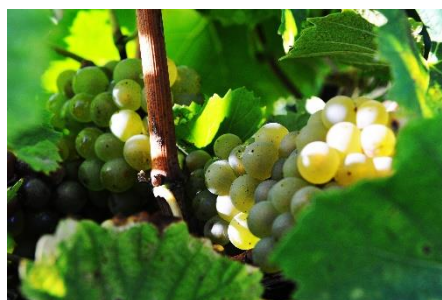
Vignobles du Val de Loire