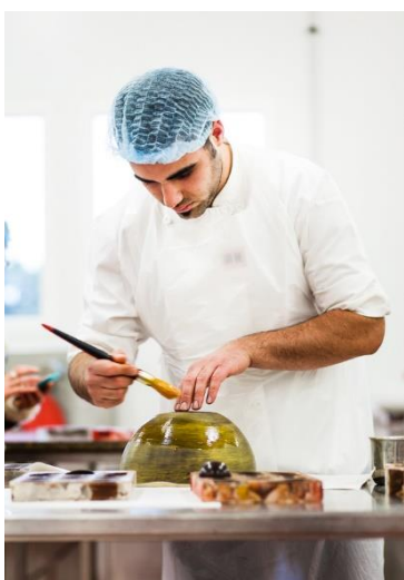
Chocolaterie Guisabel (49)

Côté campagne , à quelques kilomètres de Cholet, La Ruche de Mary (49) offre aux visiteurs une immersion bucolique dans le monde des abeilles et propose tout l'été des animations ludiques et pédagogiques sur le fonctionnement de la ruche et les bienfaits de ses nombreux trésors.