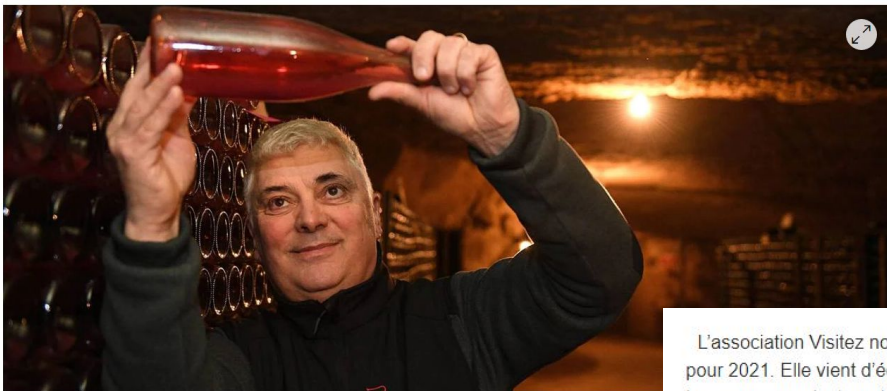
De nombreuses caves, comme Langlois, se visitent en Saumurois

Une dizaine d'entreprises saumuroises, principalement des caves, font partie du guide 2021 « Visitez nos entreprises ».