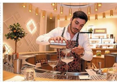
Saint-Barthélemy d'Anjou, juillet 2020. C'est au Carré Coiteaux qu'est née l'association Visitez Nos Entreprises, en 2001.

Qu'il s'agisse d'un chocolatier, d'un vigneron, d'un grand maître de vin, ou au cœur d'une fabrique de chaussures, l'association propose une expérience grand public. Les entreprises de Maine-et-Loire sont de plus en plus nombreuses à ouvrir leurs portes aux visiteurs. Ils ne restent pas longtemps. Vingt-cinq entreprises ont participé au tour de France de l'association « Une Vie de Ouf » en 2020. Depuis son lancement, elle a permis de découvrir plus de 100 entreprises et de rencontrer plus de 10 000 visiteurs.