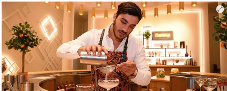
Saint-Barthélemy-d'Anjou, juillet 2020. C'est au Carré Cointreau qu'est née l'association Visitez Nos Entreprises, en 2001.

Depuis vingt ans, l'association Visitez Nos Entreprises encourage les entreprises à dévoiler leurs coulisses aux visiteurs... qui en redemandent. La filière est en pleine croissance.