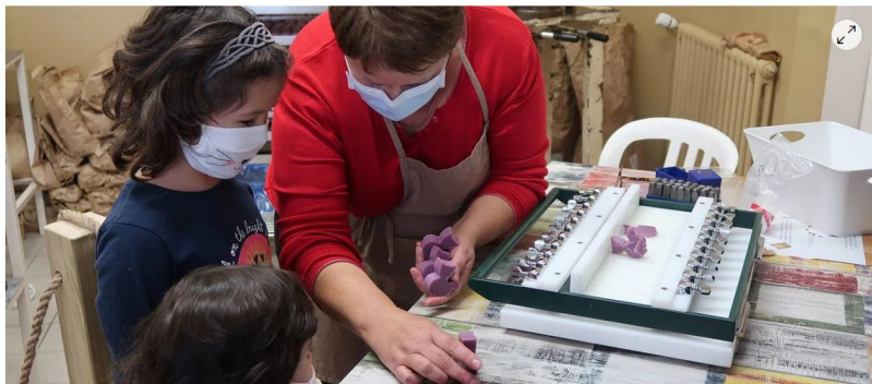
La savonnerie Gonnord à Cholet fait partie des nouveaux arrivants.

L'association « Visitez Nos Entreprises en Pays de la Loire » vient d'éditer son guide annuel, avec plusieurs nouveautés. La brochure est consultable et téléchargeable sur internet.