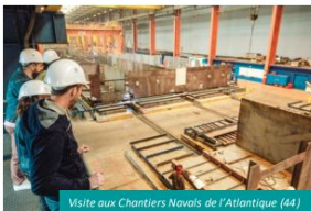
Visite aux Chantiers Navals de l'Atlantique (44)

L'association, qui fêtera son 20 ème anniversaire cette année, rassemble aujourd'hui 60 entreprises en activité dans la région Pays de la Loire et 15 partenaires associés, concernés par le tourisme de découverte économique. VNE cible la diversité des secteurs d'activités et vise l'amélioration du maillage territorial afin de répondre à l'engouement croissant de tous les publics (familles, scolaires, professionnels, habitants, touristes, particuliers ou groupes), désireux de plonger au cœur des entreprises du territoire, de découvrir la diversité des savoir-faire locaux et de rencontrer des professionnels passionnés.